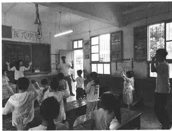
岵沙小学服务学习计划的英语课程

“从一年级到五年级都是相同的模式化基础英文字母教育，结合生动的小游戏如‘字母搭配’来与学生们进行互动。但由于语言基础不是能一天掌握的，对他们来说这也是一个不小的挑战，但同学们都完成得很好。经过几天的学习，不少同学已经掌握了 ice、apple、basketball 等单字。句子方面我们则使用 we、love、Macau、China 等字英文单字，造出‘We love Macau, We love China’等简单句子，并以答对有奖励的方式激发同学们学习英语兴趣，让他们勇于尝试。事实证明，我们做到了，有些学生虽然发音不是很标准，但也踊跃举手尝试。在最后剩下的几分钟，我们还询问了他们还想知道哪些英文单词，应该是也给他们留下了探索英语世界大门的钥匙了吧。”（岵沙小学服务学习之旅，2019年5月25日）；