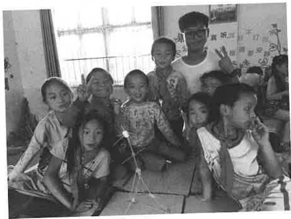
教学活动：“当棉花糖遇上意大利面”

在每次的服务学习，参加者最少在一个课堂上介绍澳门及其历史和文化，让学生知道自己居住地以外的世界。学生对这些“老师”的背景都很有兴趣，也可以更认识自己的国家和世界。